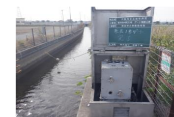
ゲート整備作業完了