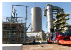
噴射水タンク据付