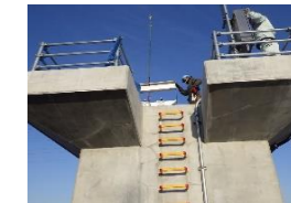
シーブカバー据付