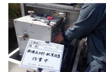
圧力計・配管設置作業