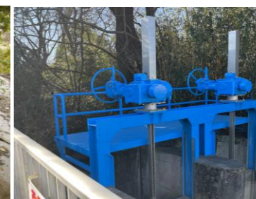
開閉装置設置完了

久しぶりに開催した 年末の食事会。 しばらくWithコロナが続きますが、短い時間ながらも開催できたことを嬉しく思います。 今後もチームワークで乗り切っていきましょう。