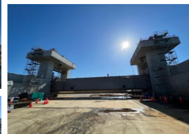
工事完成間近 前景