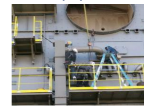
取付・位置ケガキ